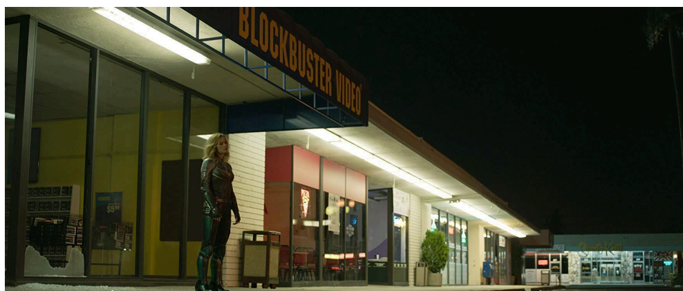
Figura 1 Nessa cena, o filme marca sua ligação com anos 90, ao utilizar a Blockbuster como retorno ao passado.

O primeiro salto que localiza o espectador no tempo acontece após sermos apresentados à personagem no planeta Hala. Em seguida, a vemos em uma batalha na qual ela acaba parando na Terra e caindo dentro da famosa locadora Blockbuster Video 4 . A cena foi filmada na última loja nos Estados Unidos, e, nesse momento, o filme revela que estamos nos anos 90. A locadora marcou uma geração por disponibilizar a locação de filmes em VHS e, mais tarde, em DVD. No filme, a personagem anda pelos corredores, olhando os títulos presentes. Em certo momento, ela para e olha o encarte do filme The Right Stuff (1983), que conta a história do programa espacial dos EUA, o que se conecta com sua história pessoal, e encontra um totem do filme True Lies (1994), de Arnold Schwarzenegger e Jamie Lee Curtis.