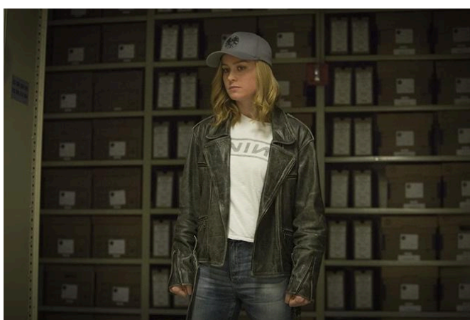
Figura 2 A protagonista reconstrói o modelo de representação feminina em filmes de ação.

Seu uniforme de capitã ficou muito diferente dos quadrinhos. Onde antes era superdecotado, agora é um uniforme que cobre seu corpo e auxilia nas cenas de ação, em que precisa correr e lutar.